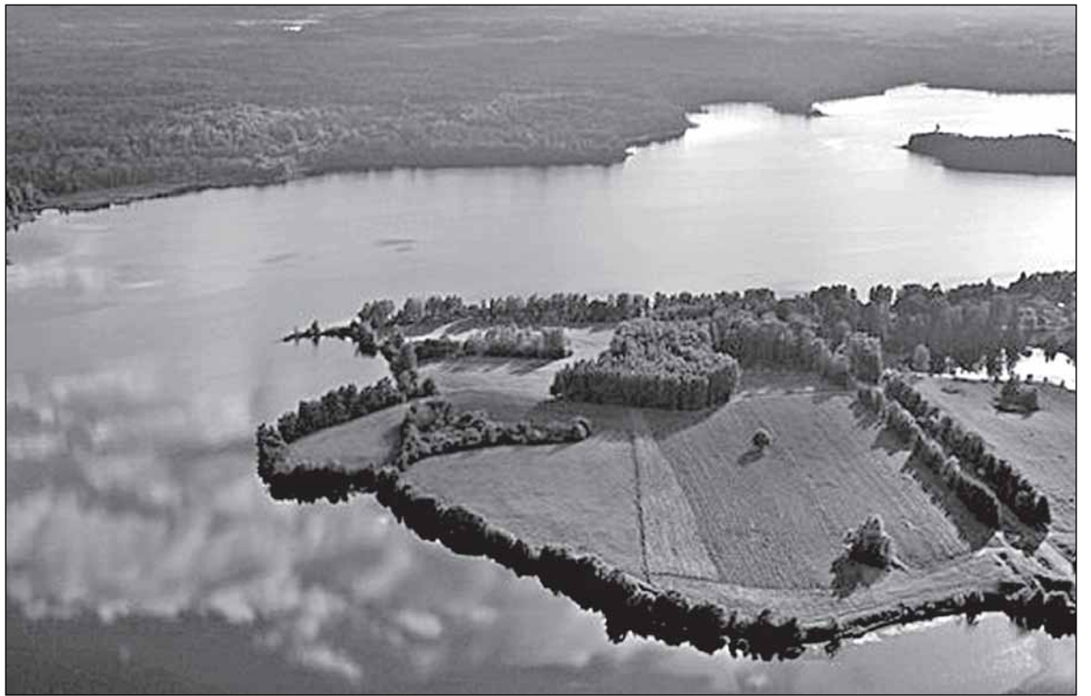
Уничтожить красоты «Страны Див» - не трудно...

До сих пор важным поставщиком форели к столу россиян остаётся Финляндия. Небольшая страна выращивает 20 тысяч тонн форели в год. Однако, напуганные тем, что творится в результате на внутренних водоёмах Суоми, опасаясь, финны сменили политику: перенесли садки на морское побережье. Лишь пятая часть рыбы по-прежнему выращивается в озёрах. Да, в результате производство в целом снизилось чуть ли не вдвое (именно это, можно предположить, и подталкивает крупную компанию вкла-